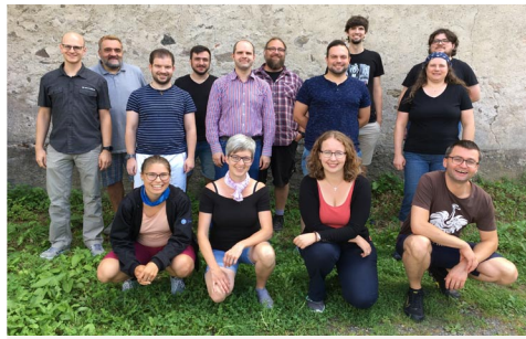
(Das Foto entstand bei der VV im August 2020)