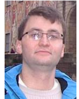
von Christoph Wiener